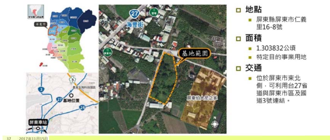
圖 2：海豐社區型師至多層級照顧園區計畫